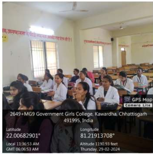
2649+MG9 Government Girls College, Kawardha, Chhattisgarh 491995, India Longitude 81.21913708° Altitude 1190.93 feet Thursday, 29-02-2024