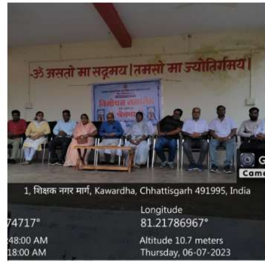
1, शिक्षक नगर मार्ग, Kawardha, Chhattisgarh 491995, India Longitude 81.21786967° Altitude 10.7 meters Thursday, 06-07-2023