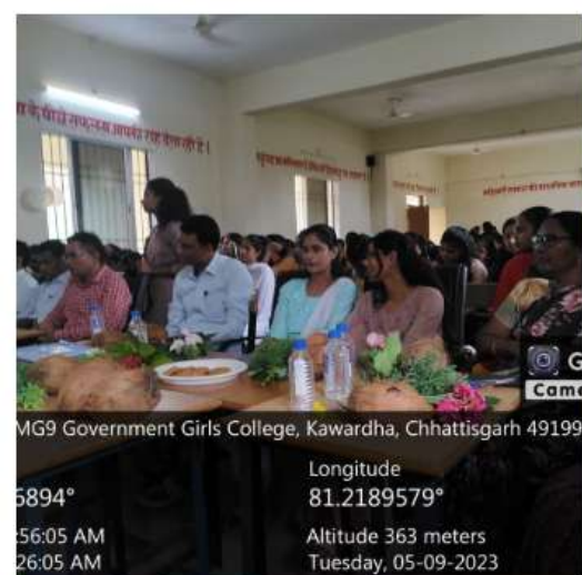
MG9 Government Girls College, Kawardha, Chhattisgarh 491995, India Longitude 81.2189579° Altitude 363 meters Tuesday, 05-09-2023