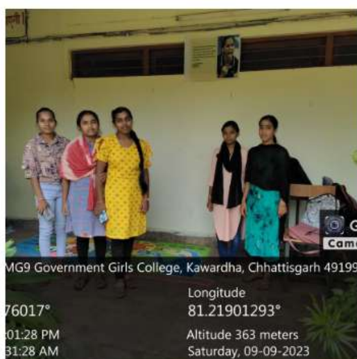
MG9 Government Girls College, Kawardha, Chhattisgarh 491995, India Longitude 81.21901293° Altitude 363 meters Saturday, 09-09-2023