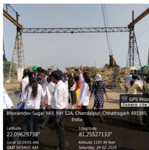
Borhamdev Sugar Mill, NH 12A, Chandalpur, Chhattisgarh 491995, India Longitude 81.25527133° Altitude 1197.49 feet Saturday, 24-02-2024