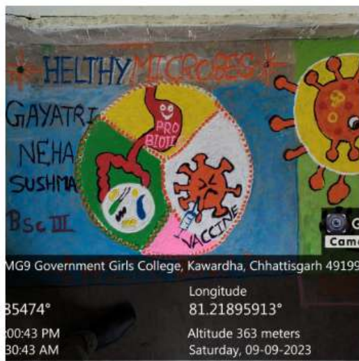
MG9 Government Girls College, Kawardha, Chhattisgarh 491995, India Longitude 81.21895913° Altitude 363 meters Saturday, 09-09-2023