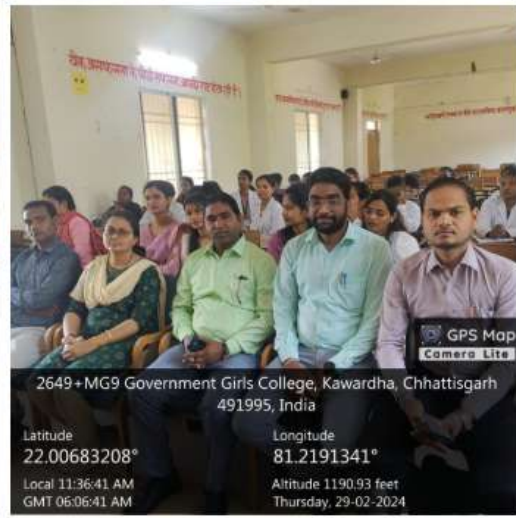
2649+MG9 Government Girls College, Kawardha, Chhattisgarh 491995, India Longitude 81.2191341° Altitude 1190.93 feet Thursday, 29-02-2024