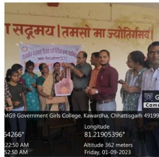
MG9 Government Girls College, Kawardha, Chhattisgarh 491995, India Longitude 81.21905396° Altitude 362 meters Friday, 01-09-2023