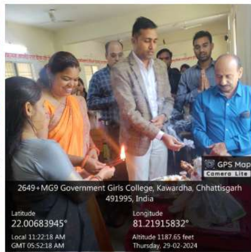
2649+MG9 Government Girls College, Kawardha, Chhattisgarh 491995, India Longitude 81.21915832° Altitude 1187.65 feet Thursday, 29-02-2024